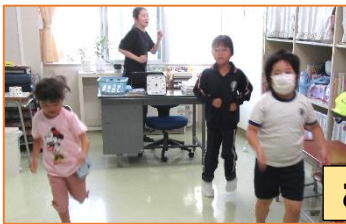
みどい報 毎朝のダンスタイム