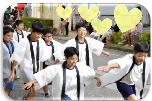
町流しでは、白萩西部地区のチームワークが光りました。